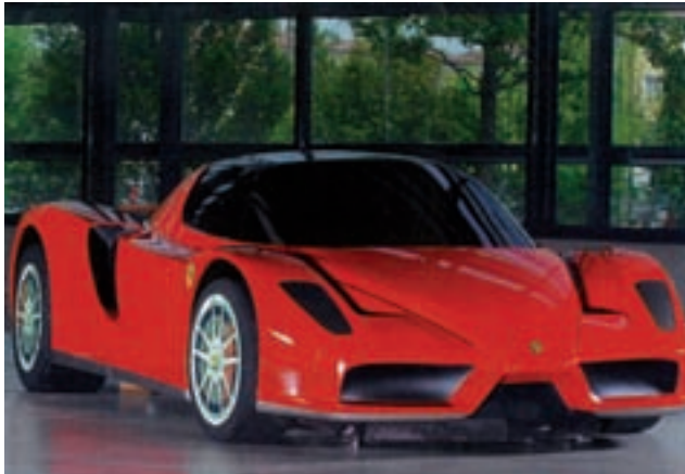
Ferrari, minder CO 2 en 40 procent minder brandstof in 2012

In de transcendente benadering, die afkomstig is uit de filosofie, bekijken we het begrip kwaliteit vanuit het ideaalbeeld. Kwaliteit wordt dan gemeten aan zaken die onbetwist boven alle lof zijn verheven. Kwaliteit vanuit deze invalshoek is zoiets als aangeboren uitmuntendheid. De bedoeling van het woord kwaliteit komen we in het dagelijkse spraakgebruik vaak tegen, vooral wanneer het niet-meetbare van kwaliteit aan de orde is. Het begrip kwaliteit is hier een relatief begrip, dat vooral wordt gehanteerd wanneer producten gevoelsmatig met elkaar worden vergeleken. Op een vraag als 'Wat is de beste auto?' zou het antwoord kunnen luiden: Rolls-Royce. En wordt de kwaliteit dan bepaald door de beste dynamo die is gebruikt? Of het beste staal waaruit de auto is gemaakt? Of de beste bumpers die zijn aangebracht? Het antwoord zal ontkennend luiden. Kwaliteit wordt in dit geval bepaald door het imago, het beeld dat men van de auto heeft. Dit imago wordt bepaald aan de hand van ervaring en geldende opvattingen over normen en waarden. Het is subjectief van aard.